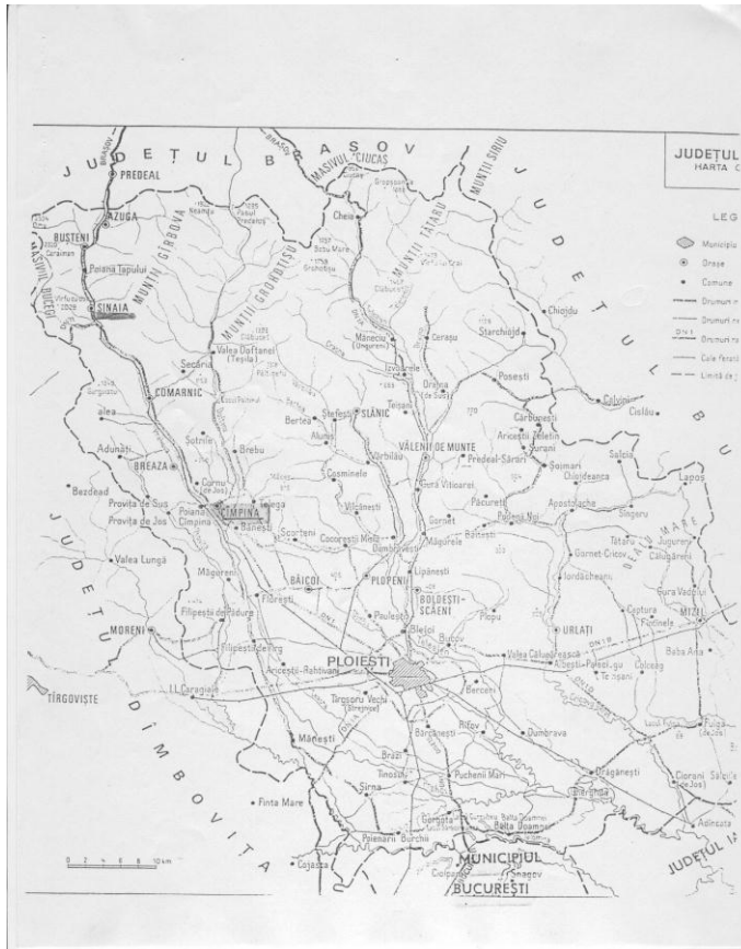
Harta Județului Prahova: localizarea municipiului și CNNG